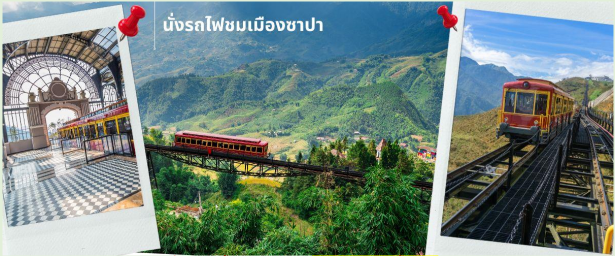
นั่งรถไฟชมเมืองซาปา

เช้า รับประทานอาหารเช้า ณ ห้องอาหารของโรงแรม (4) นำท่าน นั่งรถไฟชมเมืองซาปา (รวมค่ารถไฟชมเมือง) ท่านจะได้พบกับวิวทิวทัศน์ของเมืองซาปาที่เต็มไปด้วยความสดชื่น และสุดกลิ่นอายธรรมชาติ และยังตื่นตาไปด้วยวิวภูเขา และนาขั้นบันได ที่มีชื่อเสียงของเมืองซาปาอีกด้วย ความยาวประมาณ 2 กิโลเมตร โดยใช้เวลาประมาณ 20 นาทีเพื่อไปสู่สถานีขึ้นกระเช้าที่จะนำท่านขึ้นสู่ยอดเขาฟานซิปัน